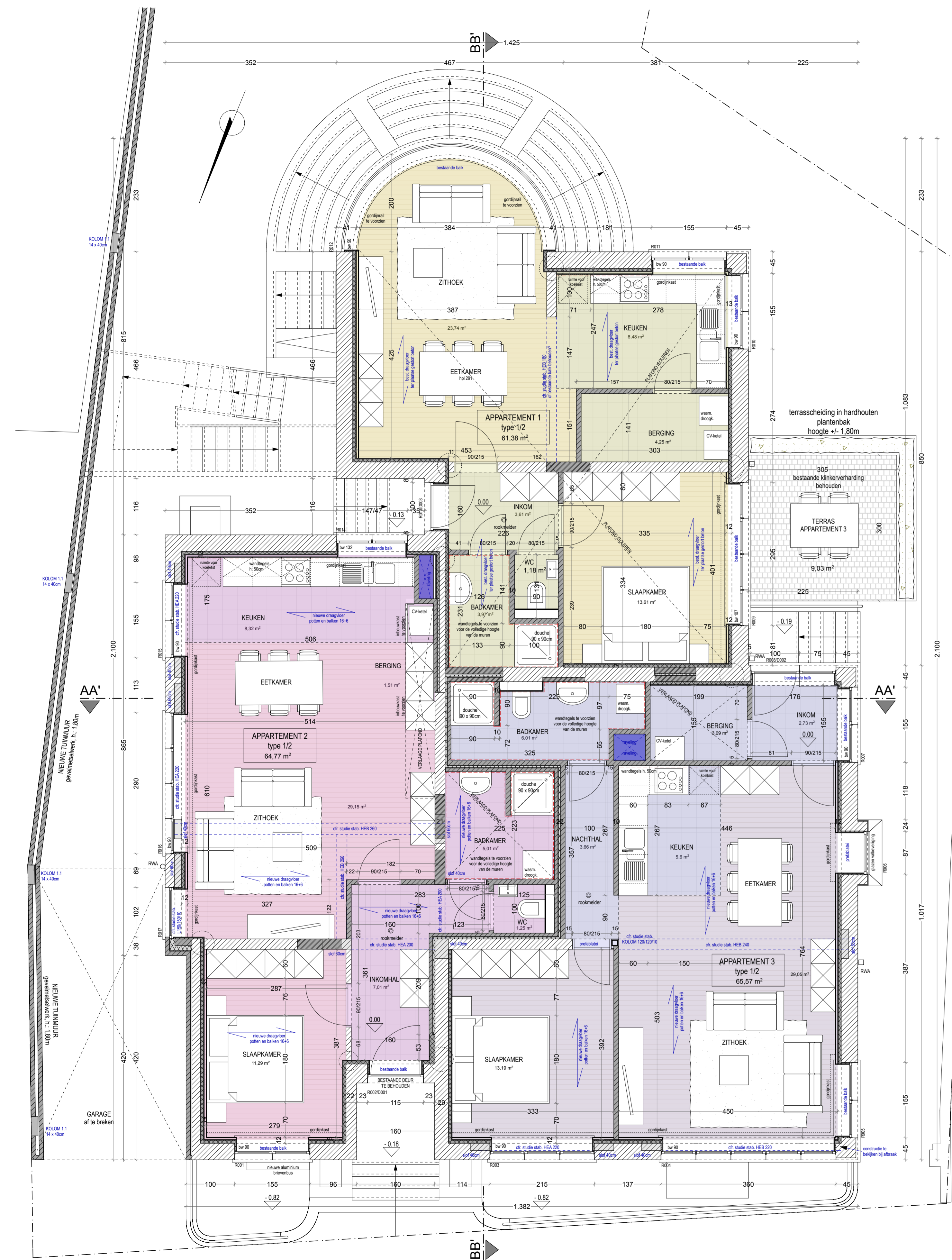
GELIJKVLOERS NIEUWE TOESTAND schaal 1:50