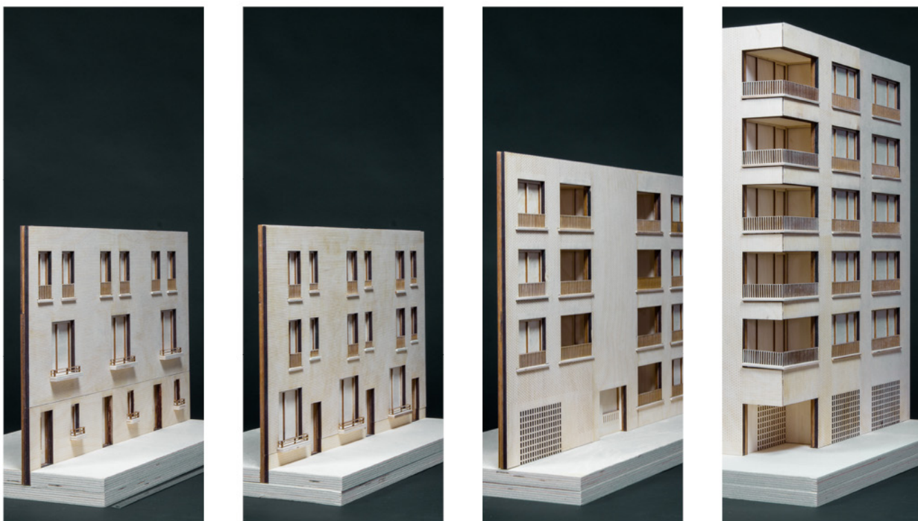
Gelaagde gevels door het werken met baksteenpatronen en raamcomposities.